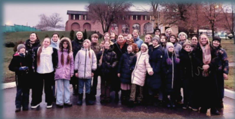
У стен Коломенского кремля. 24 ноября 2025 г.