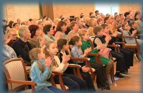
Среди публики Культурно-просветительского центра «Дубровицы» было много детей.