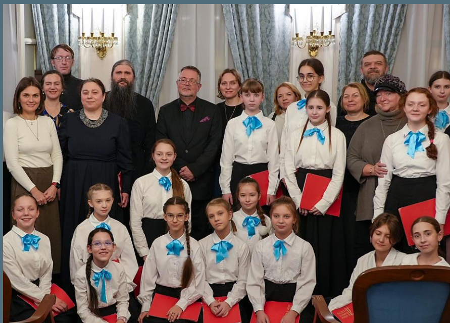
Участники и гости концерта «Заступница усердная» в Конференц-зале Московской консерватории, 19 ноября 2025 г.