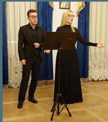
Студенты Московской консерватории